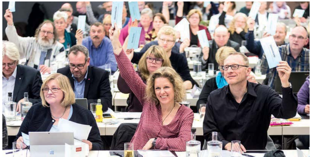
Die Bundestarifkommission beschließt am 14. Dezember 2016 in Berlin die Forderungen zur Tarif- und Besoldungsrunde 2017.

Die ver.di-Bundestarifkommission für den öffentlichen Dienst hat in ihrer Sitzung am 14. Dezember 2016 eine Forderung im Volumen von 6 Prozent für Tabellenerhöhungen und strukturelle Verbesserungen der Eingruppierung unter Berücksichtigung einer sozialen Komponente für die Tarif- und Besoldungsrunde 2017 mit der Tarifgemeinschaft deutscher Länder beschlossen.